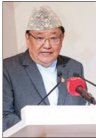
د. سانتاروك رويت

أنا متأكد من أن هذه الجائزة ستلهم العمل الإنساني الجاد الذي يتم القيام به في أجزاء مختلفة من العالم بخض النظر عن ترابيها السياسي والاجتماعي والجغرافي والاقتصادي. أود أنا وزوجتي وعائلتي أن أشكركم جميعاً على وجودكم هنا وجعله يوماً مميزاً جداً لي وعائلتي. شكراً لكم. وفي ختام الاحتفال، عزى السلام للمكي، ثم غادر حضرة صاحب الجلالة الملك المعظم مودعاً بما سبقه به من حفاوة وترحيب.